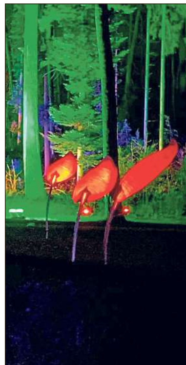
Zauberhaft: Ausflüge haben die Sonntagsfrauen zum Beispiel nach Bad Lippspringe zum Waldleuchten unternommen.

Inzwischen seien sogar schon einzelne Freundschaften geknüpft worden, erklären die Initiatorinnen mehr als vier Jahre nach dem Start der offenen Gruppe.