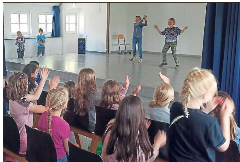
Ein mitreißendes Programm präsentierten die Mädchen und Jungen im Grundschulverbund Langenberg im Rahmen der „Offenen Bühne“.