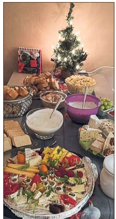
Köstlich: Bei den Weihnachtsfeiern haben die Sonntagsfrauen reichlich aufgetischt. Eine jede hat etwas mitgebracht.

„Es ist ein Lichtblick“, bringt Karin Hauser auf den Punkt, was ihr die Sonntagsfrauen bedeuten. Am Sonntag, 2. Juli, 14.30 Uhr, sind alle Interessentinnen im Café „Zur Linde“ willkommen. Weitere Infos können unter 0171/7821430 (Schwale) und 0160/4861302 (Hauser) erfragt werden.